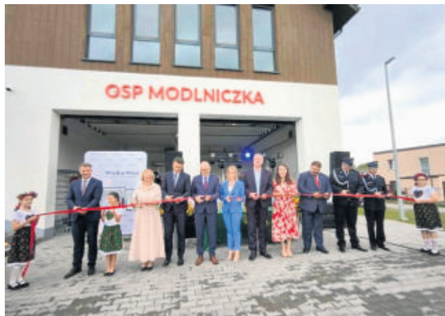
Centrum Aktywności Społecznej w Modlniczce. Obiekt oddano do użytku

Inwestycja została zrealizowana przy wsparciu Rządowego Funduszu Polski Łód: Programu Inwestycji Strategicznych - przyznana dotacja wyniosła ponad 2,3 mln zł.